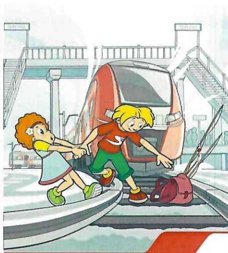
У поезда очень высокая скорость, он не сможет остановиться мгновенно. Переходи железнодорожные пути только в разрешенных местах!