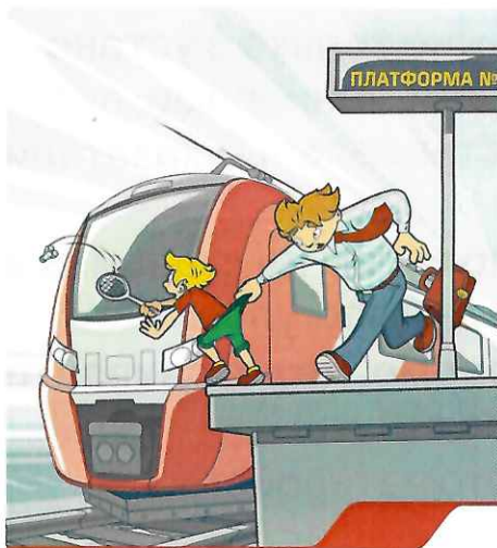
Железная дорога – не место для игр!