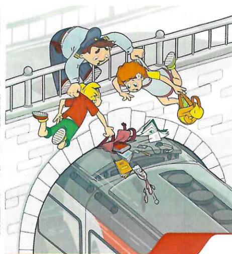
Проезд на крышах и подножках вагона опасен и может стоить жизни!